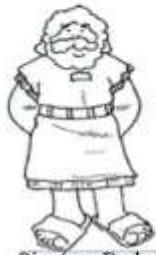
Simón - Pedro

En aquellos días él fue al monte a orar, y pasó la noche orando a Dios. Y cuando era de día, llamó a sus discípulos, y escogió a doce de ellos, a los cuales también llamó apóstoles. Y les dio autoridad sobre los espíritus inmundos, para que los echasen fuera, y para sanar toda enfermedad y toda dolencia.